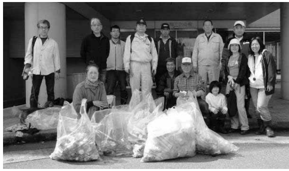
4月29日参加者のみなさん

今回はエコ活動として、魚沼市まちづくり委員会と合同でゴミ拾いを行いました。 車で走っていると雪がとけて、中から色々なゴミが出てきているのが気になっていました。でも、一人で行動を起せないので私の弱いところです。ここに事務局から話があり、まちづくり委員会の環境部会に声をかけて、合同という形で実現できました。うれしかったです。エコ容器の分別に協力してもらっている会員以外の方も参加してもらい二十名以上で、小出インター周辺と青島 浦佐を結ぶ山際の道のゴミを拾いました。しかし、数日後には福島橋付近には新しいゴミが落ちていて残念でした。 ゴミを道端に捨てて良いと思う人が減少していったらいいなと思います。(内心は、捨てるなポケッ!とつつこんでます)先日買物をしていて時、高校生の男子が落ちていた小さなゴミを拾って自分のポケットに入れていました。私も気付いていたのに拾いませんでした。(お店の人が掃除するでしょ。)と思ってたから自分には出来ないことを軽々する人を尊敬します。 話がとんでしまいましたが、ゴミ拾いをする景色は美しくなるし、よい運動になるし、皆喜ぶし、自己満足できるし、その日のビールはおいしいし、一石五鳥ぐらいいになります。次回は是非参加してませんか。七月には六十里越雪わり街道クリーン作戦もあります。お祭りにはゴミ分別活動を行います。これからも積極的に参加していきたいと思えます。