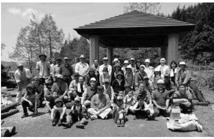
5/15 沢山の方が参加して下さいました。