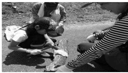
子供達も真剣に作業していました。

地球温暖化という地球規模の問題や、翻って足元の山林の荒れ方を真剣に考えると、「うおぬま森の学校」の存在の意義と必要性を強く感じる。 三年目となる「キノコの菌打ち」の参加者が多いのが唯一救いの事業である。やっぱり「食べる」事に直結しているものは強い。私達の歩みはのろいが歩みを止める訳には行かない。