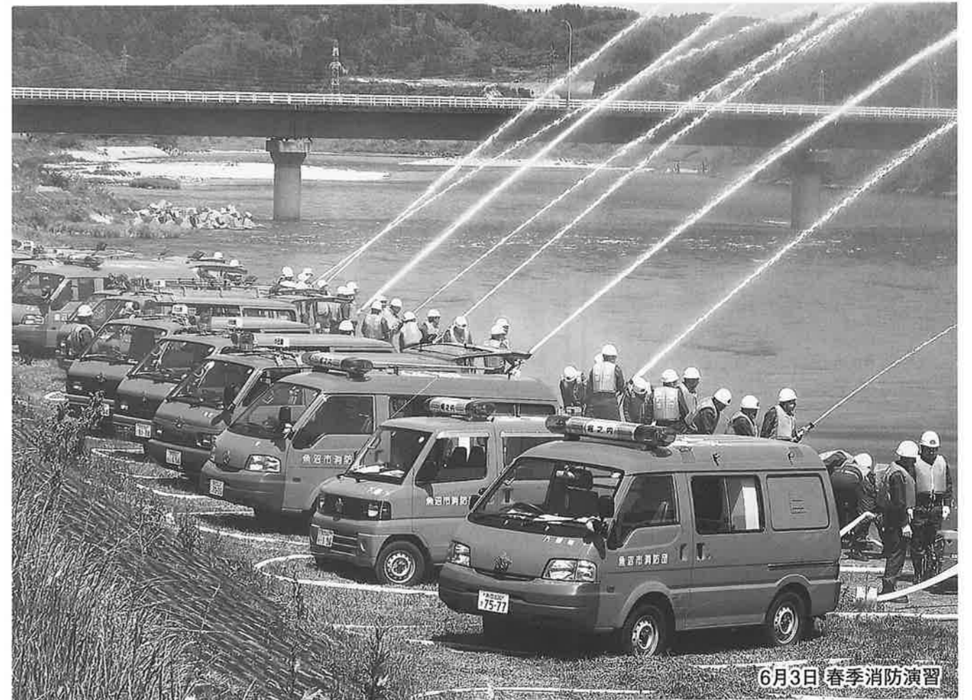
6月3日 春季消防演習