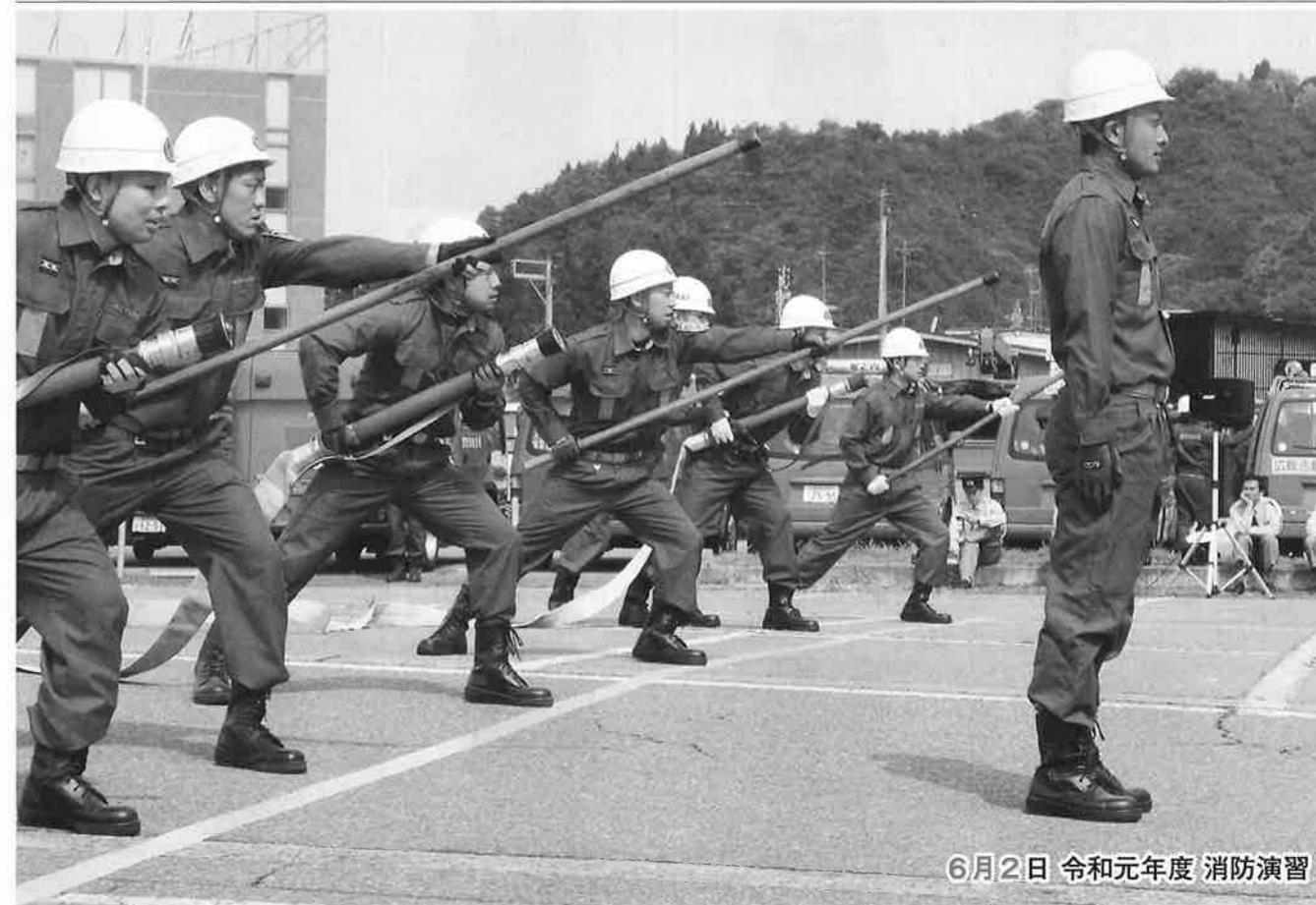
6月2日 令和元年度 消防演習